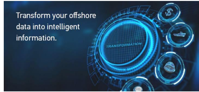
オフショア情報のデジタル化と応用 - Marlin プラットフォームでのプロジェクト運用の統合と効率化 -

ニューヨーク証券取引所に上場（名称：IO）、テキサス州ヒューストンの本社と、世界各地に支店を保有しています。従業員数は 400 名を超え、その約半数が技術職であり、1/4 が修士以上の学位を保有しています。